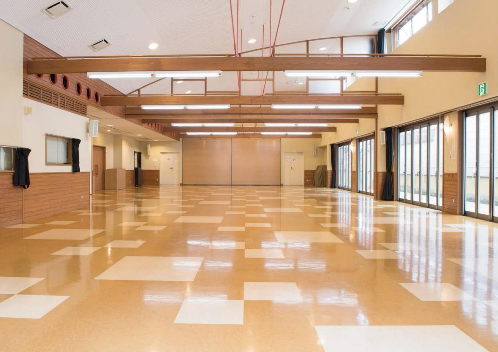
入口からステージ側を見たところ

鳥取市の中心市街地に位置する当ホールは、 多彩なイベントを企画し、 地域のコミュニティ拠点として、 また、市民の交流機会を創出する広域交流拠点として、 皆様にご利用いただいております。